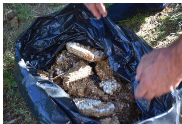
■ Le nid de frelons a été détruit par les pompiers.