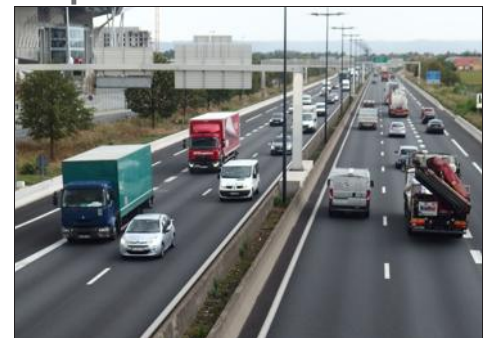
■ La Rocade est.

- A 46 nord : du 10 au 13 septembre inclus, de 21 heures à 6 heures, la circulation est interdite entre Neuville-sur-Saône (échangeur n° 2) et le nœud d'Anse, en direction de Paris.